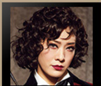
ジョルジュ・サンド ＜永久輝 せあ＞ 男装の女流作家