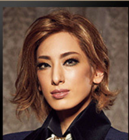
フランツ・リスト ＜柚香 光＞ ピアノの魔術師と称される ピアニスト 作曲家