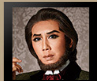
ヴィクトル・ユゴー ＜高翔 みず希＞ 小説家・詩人